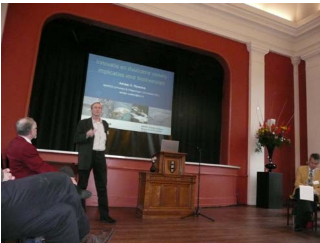
Deze foto geeft een beetje een beeld van het congres ik heb geen foto van de hele zaal.

Meer info vind over dit congres vind je op http://www.artis.nl/artis-academie/congres-biodiversiteit/