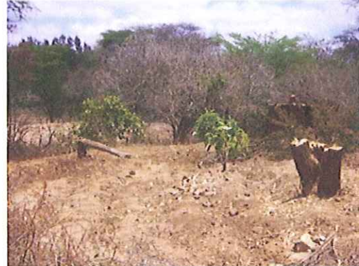
(Voor houtskool gekapte bomen)

Het export verbod en extern inkopen bewijst dat er bos nodig is in Kenia.