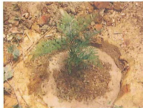
(Een nieuw geplante boom)