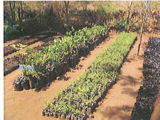
(Kwekerij voor jonge boompjes)